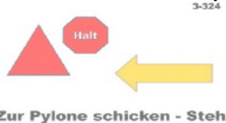
Zur Pylone schicken - Steh

Fleißig melden - wir freuen uns auf Euch!